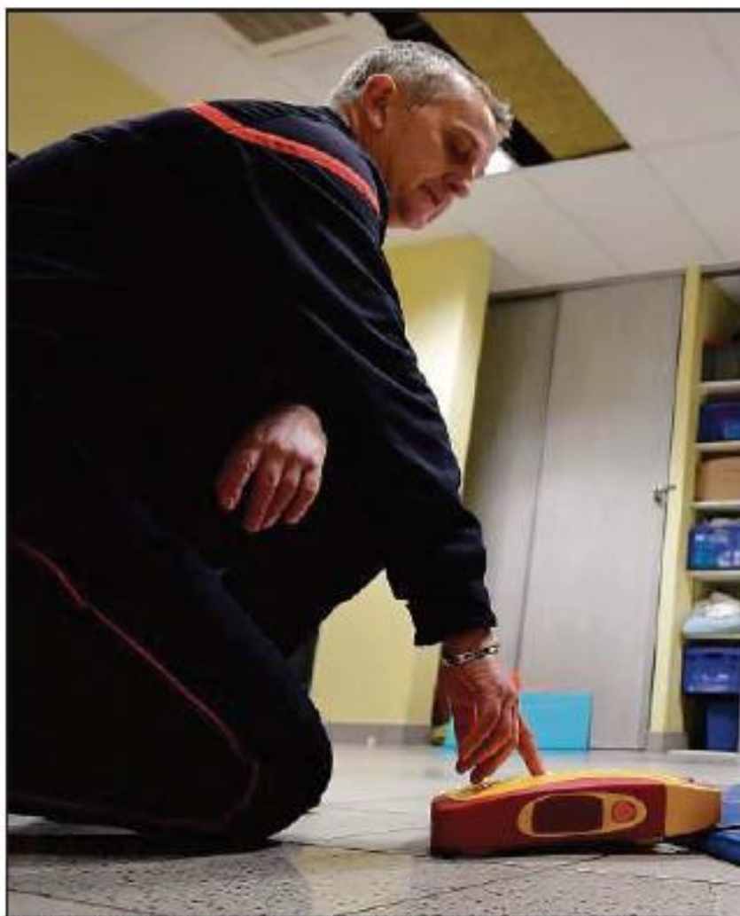
FORMATION. Depuis 2007, toute personne, même non formée, peut utiliser un DAE, pour défibrillateur externe.

Pour quatre-vingt-dix-neuf questionnaires envoyés, seize-vingt-deux DAE ont été recensés.